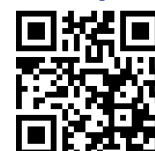
Table des résistances chimiques

Chaque lot de seringues Ecotep™ stérilisées est testé sur le plan de la stérilité par un laboratoire indépendant et certifié exempt d'ADN humain, de DNase, de RNase et de pyrogènes (endotoxines).